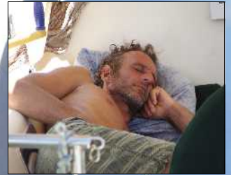
J'ai vécu les Antilles... autrement

Antilles, archipel des Saintes, 15 mai 2010, 35° à l'extérieur. Je suis dans ma cabine sous deux couettes, et j'ai froid, terriblement. Je suis venu ici pour explorer cette humanité que je cherche dans mon voyage, avec mon voilier Miss Terre, et je suis là, délirant ne connaissant pas ma prochaine destination. La saison des cyclones approche dangereusement... Terrassé par la leptospirose, cette maladie tropicale mortelle, je ne sais pas encore que je vais m'engager dans la plus étrange convalescence de ma vie.